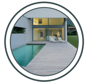
Pools, Saunas Pools, Saunas