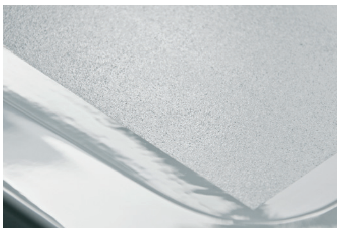
GriP AntiRutsch® Beschichtung in Duschwanne GriP AntiSlip® coating in a shower tray

3 000 000 “Slip accidents requiring treatment” in Germany, according to calculations by leading insurance companies.