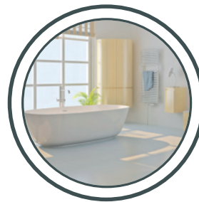
Badewannen, Duschen Bathtubs, Shower trays.