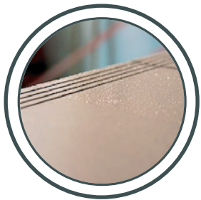
Treppen, Foyers Stairs, lobbies

GRIP ANTISLIP® PROVIDES SAFETY IN MANY PUBLIC AND COMMERCIAL AREAS.