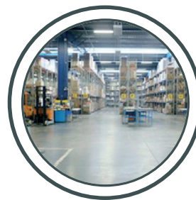
Lagerhallen, Schmutzschleusen Warehouses, entry areas