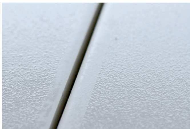
GriP AntiRutsch® Beschichtung auf Bodenfliese GriP AntiSlip® coating on floor tile