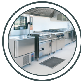
Großküchen, Kantinen Kitchens, Canteens