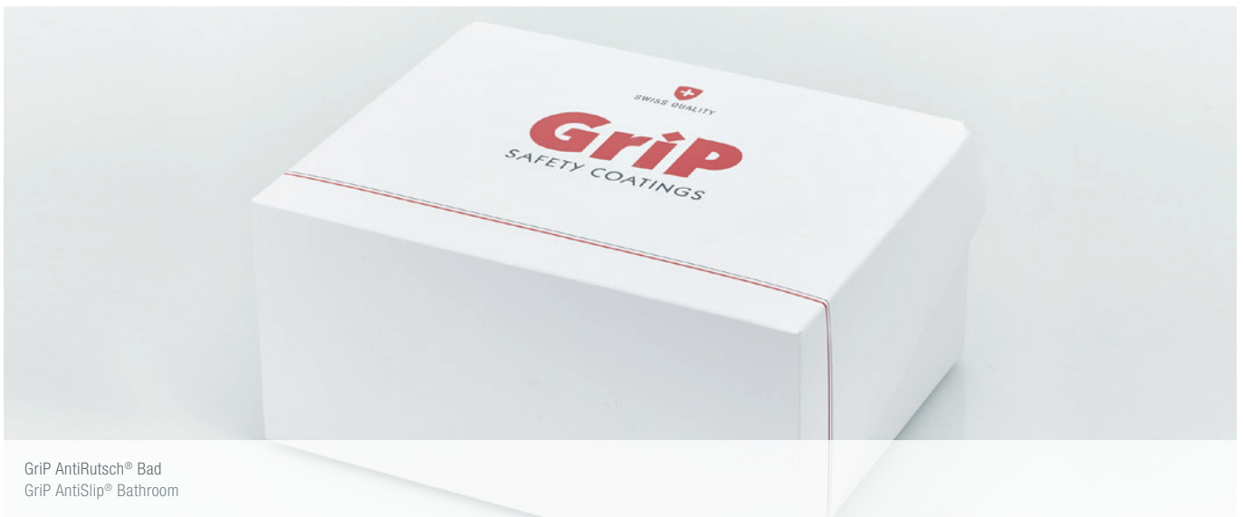
GriP AntiRutsch® Bad GriP AntiSlip® Bathroom