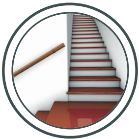
Eingänge, Treppen Entry areas, Staircases.

GRIP ANTISLIP® PROVIDES SAFETY IN MANY PLACES IN AND AROUND YOUR HOUSE.