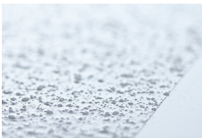
GriP AntiRutsch® Beschichtung in 20-facher Vergrößerung GriP AntiSlip® coating, magnified 20 times.