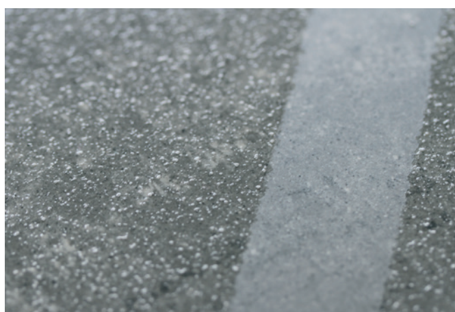
GriP AntiRutsch® Beschichtung auf Stein. GriP AntiSlip® coating on stone.